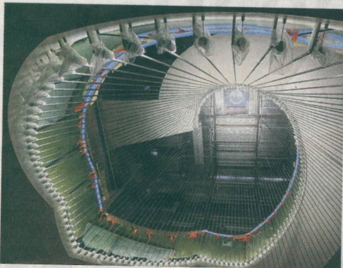
L'escalier de la Bibliothèque nationale et universitaire de Strasbourg (BNUS) : une prouesse.

Le palmarès des 32 e prix d'architecture du Moniteur sera connu le lundi 17 novembre au soir. On connaîtra le nom des architectes qui recevront l'Équerre d'argent, une sorte de prix Pritzker national.