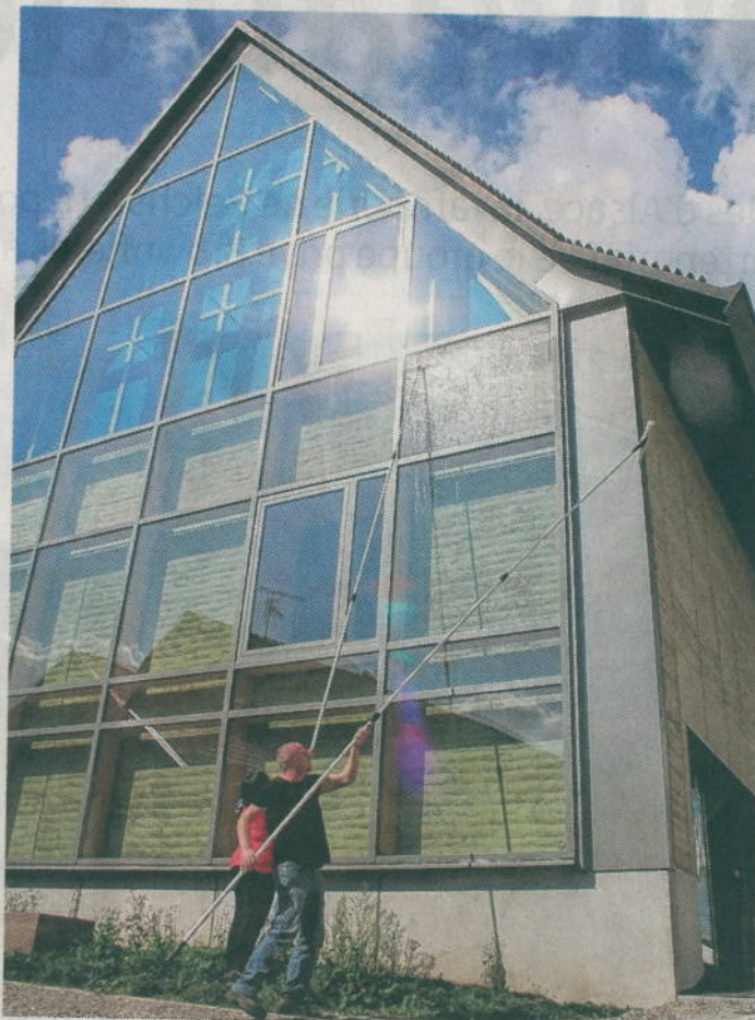
Le Centre d'interprétation du patrimoine (CIP) de Dehlingen en Alsace Bossue.

Deux projets ont été retenus en Alsace : le Centre d'interprétation du patrimoine archéologique de Dehlingen, associant le cabinet Nunc Architectes et la communauté de communes d'Alsace Bossue, et la réhabilitation de la Bibliothè-